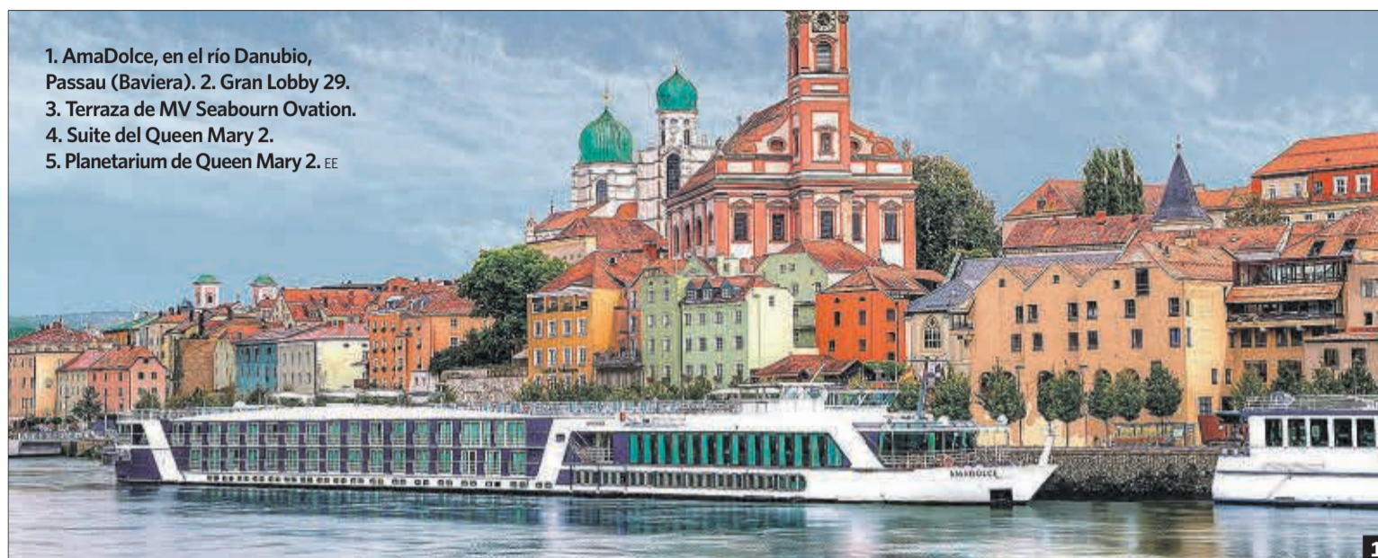
1. AmaDolce, en el río Danubio, Passau (Baviera). 2. Gran Lobby 29. 3. Terraza de MV Seabourn Ovation. 4. Suite del Queen Mary 2. 5. Planetarium de Queen Mary 2. EE